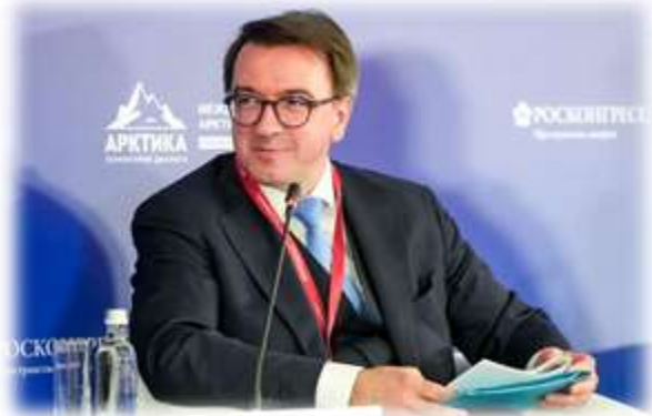
Владислав Масленников, директор Департамента европейских проблем Министерства иностранных дел Российской Федерации

26 марта 2025 года, МАФ «Арктика – территория диалога»