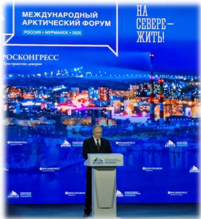
Владимир Владимирович Путин, Президент Российской Федерации

27 марта 2025 года, МАФ «Арктика – территория диалога»